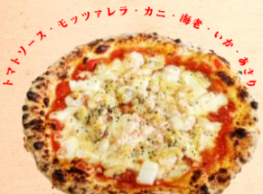
シーフードピッツァ