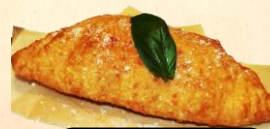
揚げピッツァ (マルゲリータ)