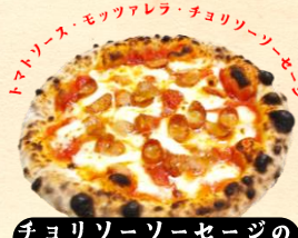
チオリソーソーセージの ピリ辛ピッツァ