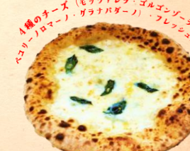
クワトロフォルマッジ