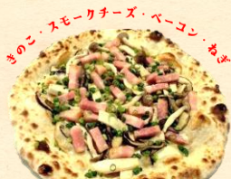
きのこ&スモーク チーズのピッツァ