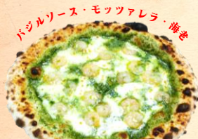
海老とモッツアレラの ジェノヴァピッツァ