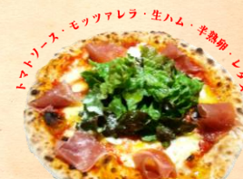
生ハムと半熟卵の ビスマルク