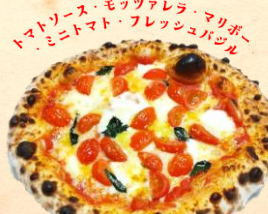
竹下牧場2種チーズと ミニトマトのピッツァ